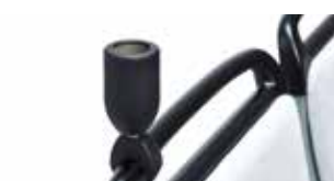
Stangenhalter Handpole connector