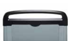
Mit Kinnschutzhaltegriff With grab handle