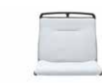
Mutterkindsitz Mother and child seat