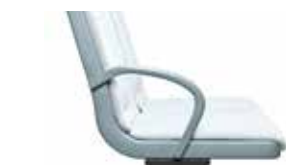
Mit Abweisbügel With hip restraint