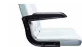
Mit klappbarer Armlehne Foldable armrest