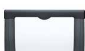
Mit Kinnschutz Chin protection