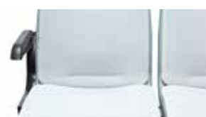
Behindertensitzkissen Disabled seat covers